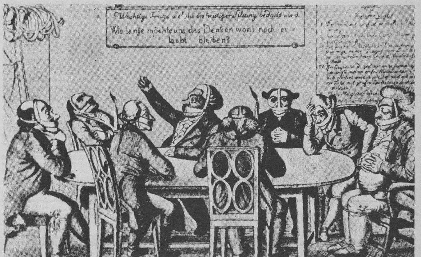
Stampa del 1819: il feroce cancelliere Metternich aveva messo fuori legge in tutti gli stati tedeschi le libertà politiche e civili più elementari (in primo luogo di stampa e di associazione), colpendo soprattutto associazioni studentesche ed ogni altra forma di attività politica democratica organizzata. La questione che viene discussa nella riunione qui sopra raffigurata riguarda « quanto tempo ancora ci sarà permesso pensare »

Questa decisione è avvenuta a tappe forzate, per non lasciare il tempo di crescere al movimento di mobilitazione, ed è stata interamente imposta sull'ondata di una campagna governativa contro il « terrorismo morale » che oggi il « sinistrismo imperante » eserciterebbe nella letteratura, nei giornali, nei programmi culturali del cinema, della radio e della televisione, nell'arte, oltre che con volantini, ciclostilati, comizi ed altri stru-