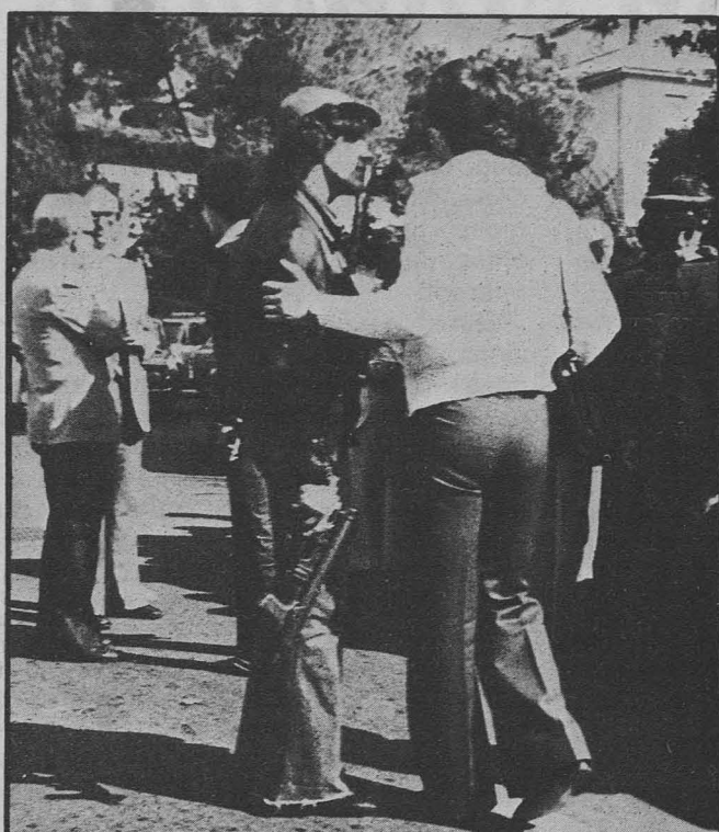
Polizia e tiratori scelti dell'antiterrorismo ieri mattina davanti all'ambasciata siriana

ROMA, 11 — Per circa un'ora e mezzo, questa mattina, l'ambasciata siriana a Roma è stata occupata da un «commando». I tre componenti del gruppo, tutti e tre studenti, un libanese, un palestinese, un siriano, sono arrivati all'ambasciata poco prima delle 11. Sono entrati senza incontrare resistenza.