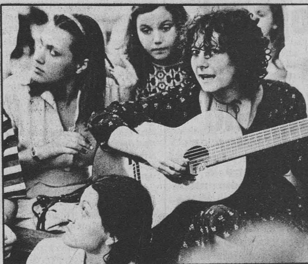
Roma - La festa delle donne della Magliana nel giugno di quest'anno

La polisportiva «Giovani Castello» ha stampato un manifesto su Italia-Cile di tennis, molto bello. Il costo approssimativo per ogni copia è di cento lire (vengono spediti in pacchi di minimo cinquanta). E' uscito anche il mensile (curato dalla Castello) «IL RONZINO»; questo numero — bellissimo — contiene le posizioni di Paese Sera, Rinascente, Unità, QdL, Manifesto, Lotta Continua e del circolo sulle Olimpiadi e sul dopomontreal (un numero lire cento, abbonamento annuo, lire mille). Tutto questo materiale può essere richiesto scrivendo a Circolo Castello, piazza Dante, 2 - ROMA.