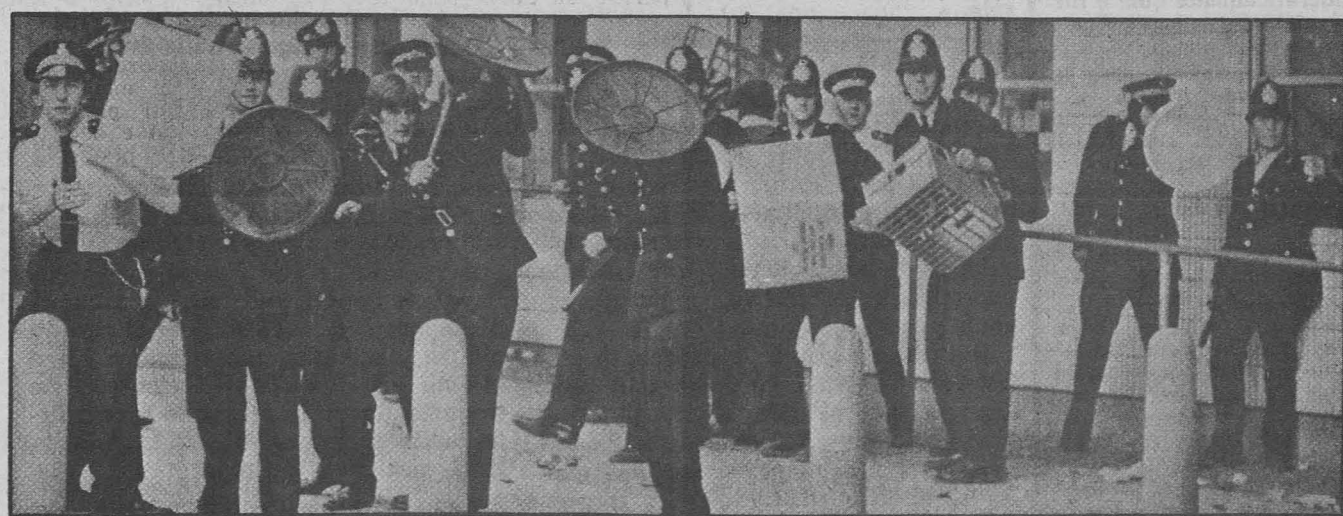
La polizia londinese di fronte alla rivolta dei giovani neri a Notting Hill - Alla fabbrica Ford di Dagenham le cose sono andate più o meno allo stesso modo

oltre che sul terreno salariale (quattro sterline in più alla settimana), anche su quello sollevato dagli operai del turno di notte, con lievi miglioramenti rispetto alla paga delle ore di sospensione che però appaiono destinati ad essere decisamente respinti dagli operai. Che la Ford sia sulla via del cedimento si può spiegare sia col peso dello sciopero dei suoi impianti americani, che moltiplica la « fame di produzione » dei suoi stabilimenti europei, sia con le esigenze relative al lancio del nuovo modello, che la lotta ha colpito in maniera purissima. L'analisi puntuale di questa lotta e del suo significato politico, che ci è fornita dalla lettera spedita alcuni giorni fa dal compagno Peter Martin (già noto in Italia per un suo importante articolo, appunto sulla Ford, sull'ultimo numero di « Priore Maggio »), ci pare assai utile per comprendere il livello di scontro tra le classi in Gran Bretagna. Ne riportiamo ampi stralci. « Lo sciopero di Dagenham è di importanza straordinaria per diversi